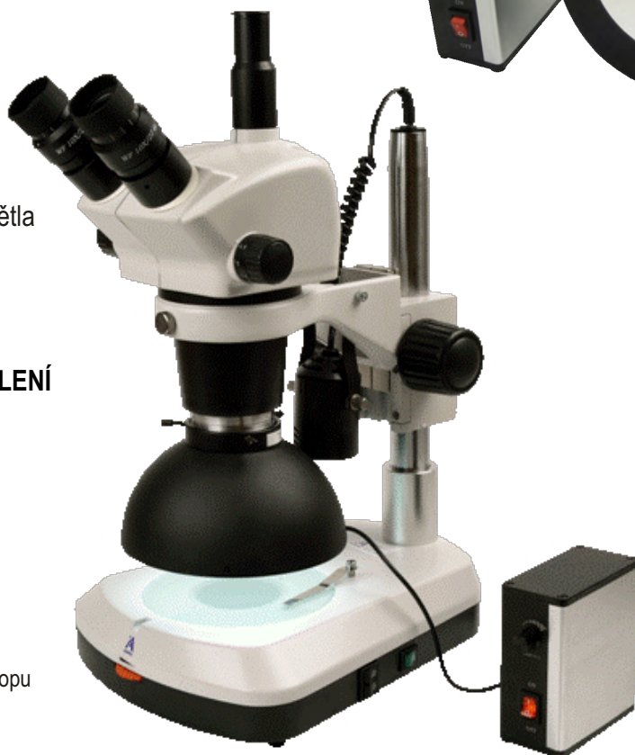
Difúzní světlo na stereomikroskopu SZP 3302-T ZOOM LED