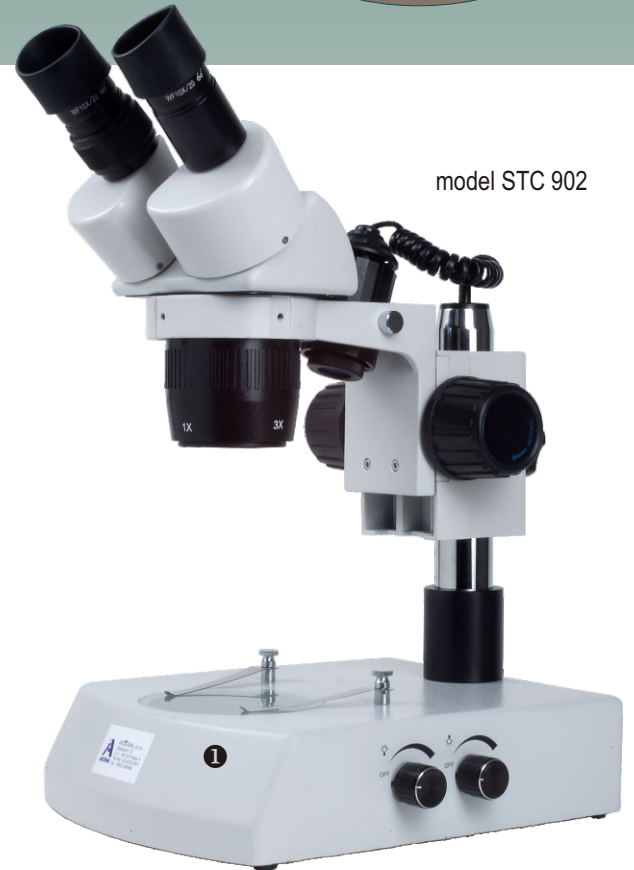
model STC 902

Výhodou je zvláště velký pracovní stůl ①, výhodný pro pozorování větších předmětů.