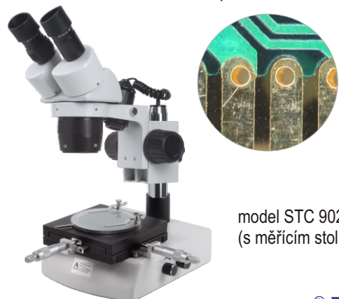
model STC 902- M (s měřicím stolem)

Digitální kamery CMOS pomohou šetřit Vaše oči při práci - můžete obraz pohodlně sledovat na obrazovce Vašeho PC či notebooku. Pozorování na velké obrazovce ocení nejen vyučující, aby názorně předvedli studentům předmět pozorování, ale také ti, kteří potřebují kolegům ukázat např. vady či nedostatky sledovaných výrobků.